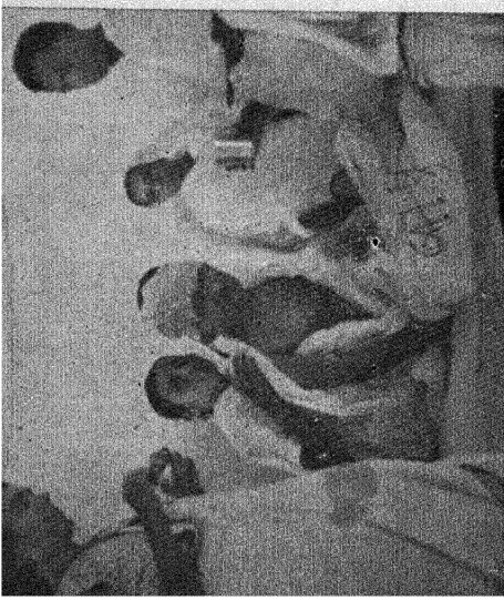
बापू : राजकोट में उपवास के समय